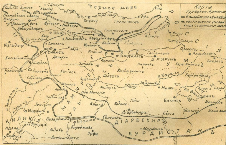
Карта турецкой Арменіи.

Послѣ разрѣшенія всѣхъ этихъ вопросовъ для Россіи открывается право на обладаніе „дверью ея собственнаго дома“ — проливами, тѣмъ болѣе, что обла-