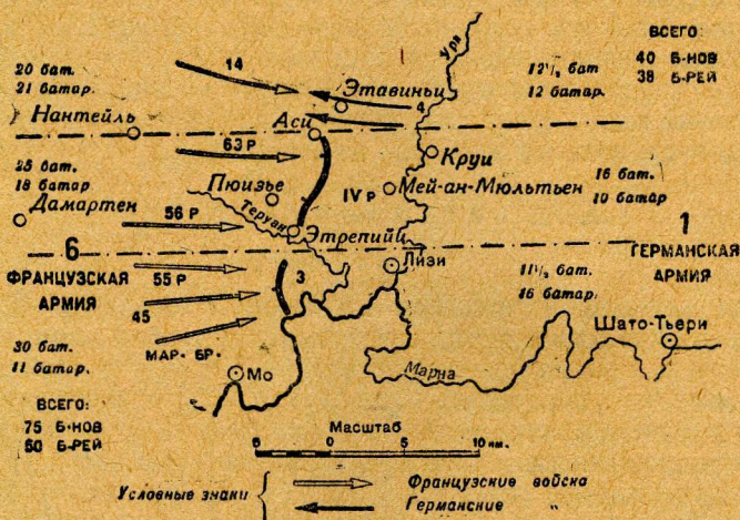
Схема VI. Соотношение сил к западу от р. Урк 6 сентября 1914 г.

Когда в ночь с 5 на 6 сентября в штабе 1-й германской армии узнали о встречном бое IV резервного корпуса, там предположили, что корпус имел дело с французскими войсками, прикрывавшими отступление своих главных сил за р. Сену. Поэтому Клуке продолжал маневр, а для поддержки войск Гронау был направлен II армейский корпус ген. Линзингена, который, следуя по пятам за англичанами, накануне находился южнее р. Марны, подходя к району Куломье на р. В. Морэн.