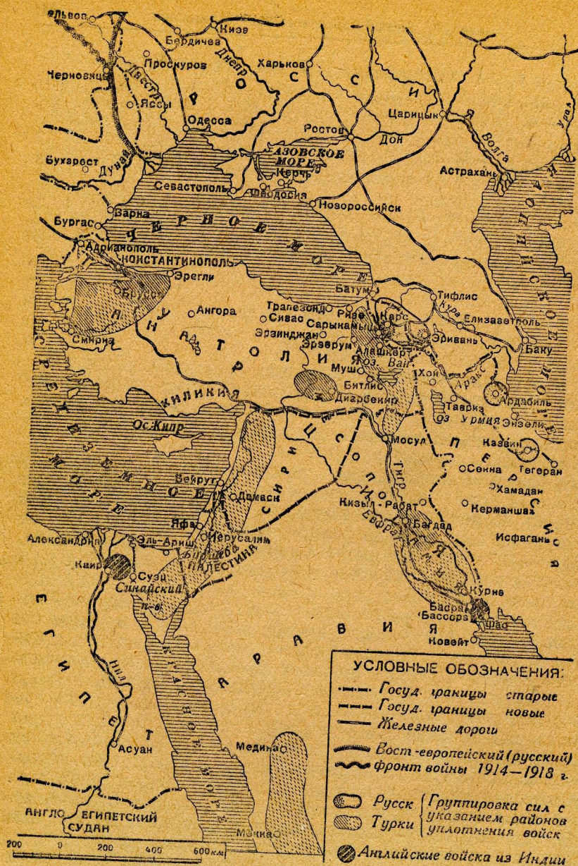
Схема XII. Азиатско-турецкий театр мировой войны