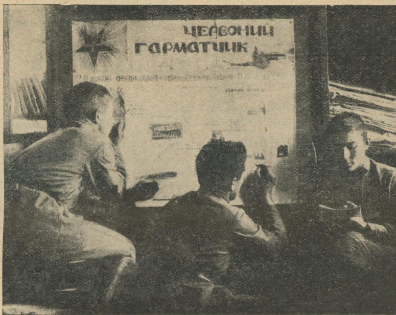
Готовят стенную газету