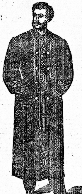
Фрачн. пара отъ Р. 28—45.