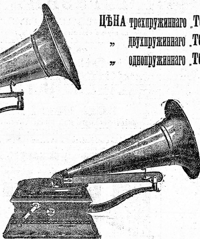
Граммoфонъ № 6x